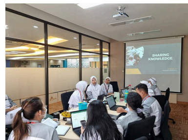
フレイアパディ インドタマ（インドネシア） における教育活動

また海外グループ会社では、「品質安全月間」（不二製油（張家港）有限公司（中国））、「品質・食品安全の日」（ハラルド（ブラジル））、「品質と食品安全文化啓発プログラム」（フレイアパディ インドタマ（インドネシア））などのイベント開催による意識向上を図っています。